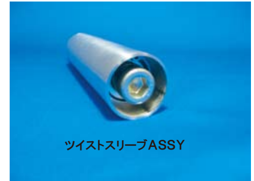
ツイストスリーブASSY

装着状態でインナーパーツが取り外せる為、ハンドル組み付け後のワイヤー取り付け作業や調整、メンテナンス性も大変優れています。